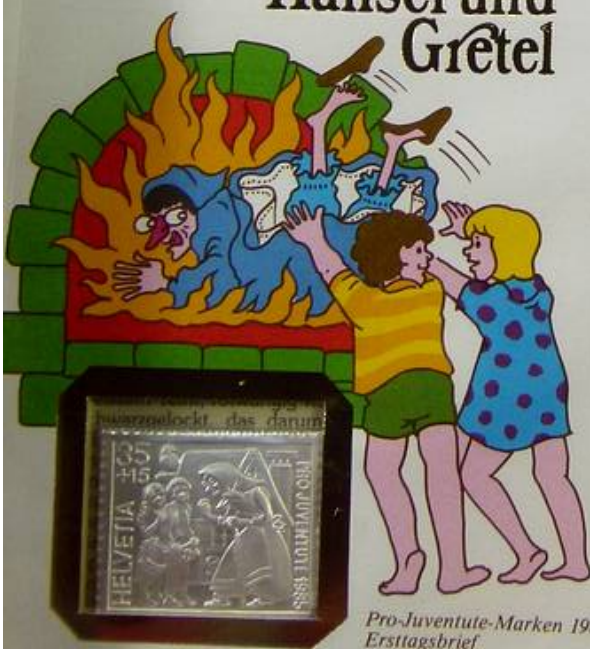
Pro-Juventute-Marken 1985 Ersttagsbrief