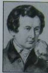
Jacob Grimm Sprachwissenschaftler. Begründer der deutschen Philologie. Begann 1861 das «Deutsche Wörterbuch» † 20. 9. 1863

So machten sich dann die Brüder, als Jacob 22 und Wilhelm 21 Jahre alt waren, auf die Suche nach Leuten mit gutem Gedächtnis. So einfach war das nun wieder nicht, denn wer solche Märchen kannte, hielt die Fragenden nicht selten für ein bißchen verrückt.