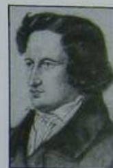
Wilhelm Grimm Erzähler und Sprachforscher. Arbeitete mit seinem Bruder an den «Kinder- und Hausmärchen» † 16. 12. 1859