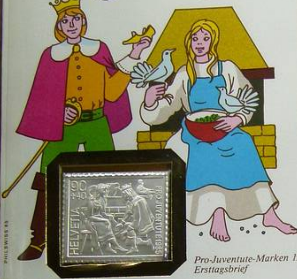
Pro-Juventute-Marken 1985 Ersttagsbrief