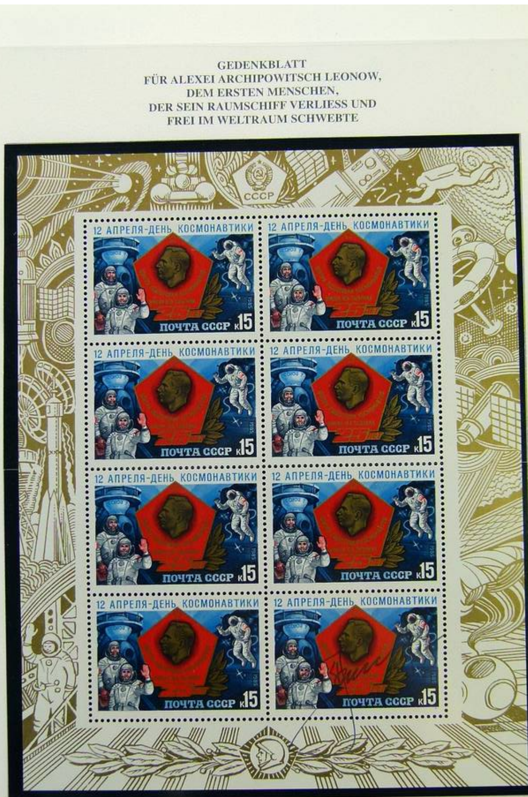
ALEXEI ARCHIPOWITSCH LEONOW