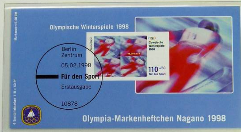
Olympia-Markenheftchen mit Zuschlag „Für den Sport 1998“