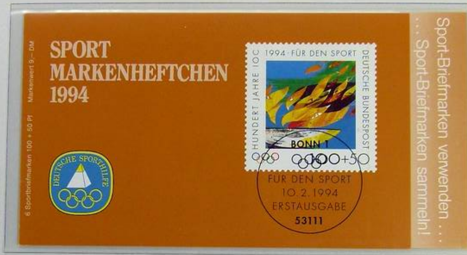
Sport-Markenheftchen 1994 mit offiziellem Farbsonderdruck der Stiftung Deutsche Sporthilfe