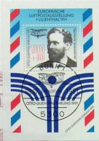
Otto Lilienthal (1848 - 1896) fasste seine Philosophie einmal treffend in die Worte: „Eine Flugmaschine zu erfinden bedeutet nichts; sie zu bauen nicht viel; sie zu fliegen alles!“

Otto Lilienthal – ein Höhepunkt im Jahr 1991! Vom Fliegen träumen ist heute ganz anders. Vor hundert Jahren wurde der deutsche Flugpionier Otto Lilienthal, der mit einem Gleiter aus Holzstäben und Seidenpapier zusammengeknüpft war, an die 2500 Flüge führte er damit den Grundstein für die Entwicklung der Luftfahrt für die Deutsche Bundes- post. Die hervorragende Leistung Otto Lilienthals wird auch zur Erinnerung daran, daß die Luftpostausstellung „LILIENTHAL '91“ ein Höhepunkt Ihres philatelistischen Sammelalbums ist. Herzliche Grüße von Ihrer Postministerin und lieber Abonnent,